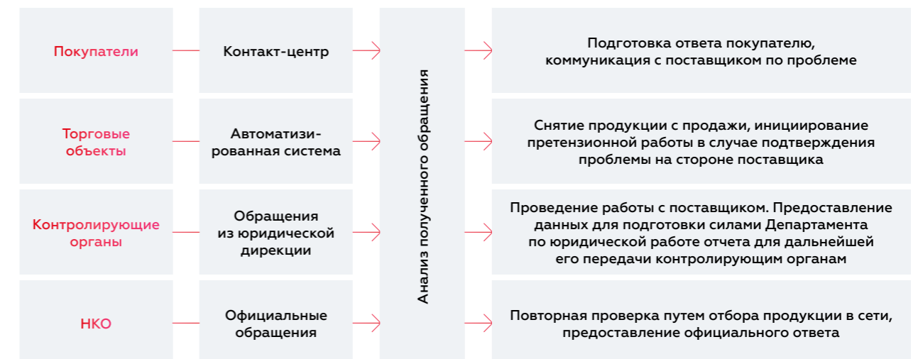
Схема отработки обращений о качестве продукции

связанных с качеством продукции поставщиков, включая продукцию собственного производства, поступило в адрес Компании в 2024 г.